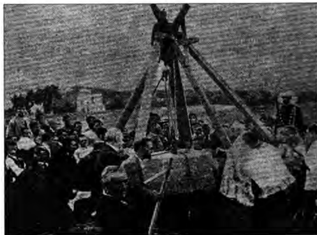
Col·locació de la primera pedra de l'edifici del Col·legi, el 30 de juny de 1894

Amb tantes coses que han passat, i tan soroll que hi ha hagut, no podem oblidar el més important. Ara mateix, sobre la taula, quines opcions de futur hi ha per al Col·legi El Roser? La situació és crítica, i moltes famílies ja estan pensant en altres centres per escolaritzar els seus fills el setembre d'enguany.